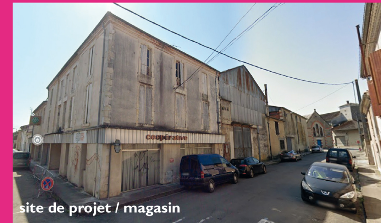
site de projet / magasin