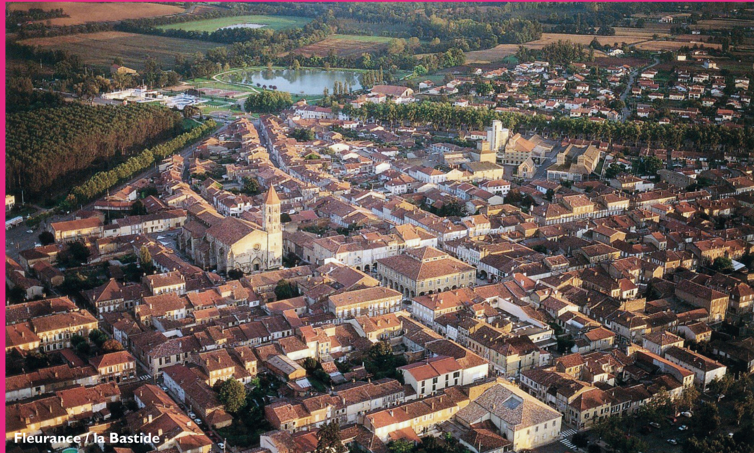
Fleurance / la Bastide