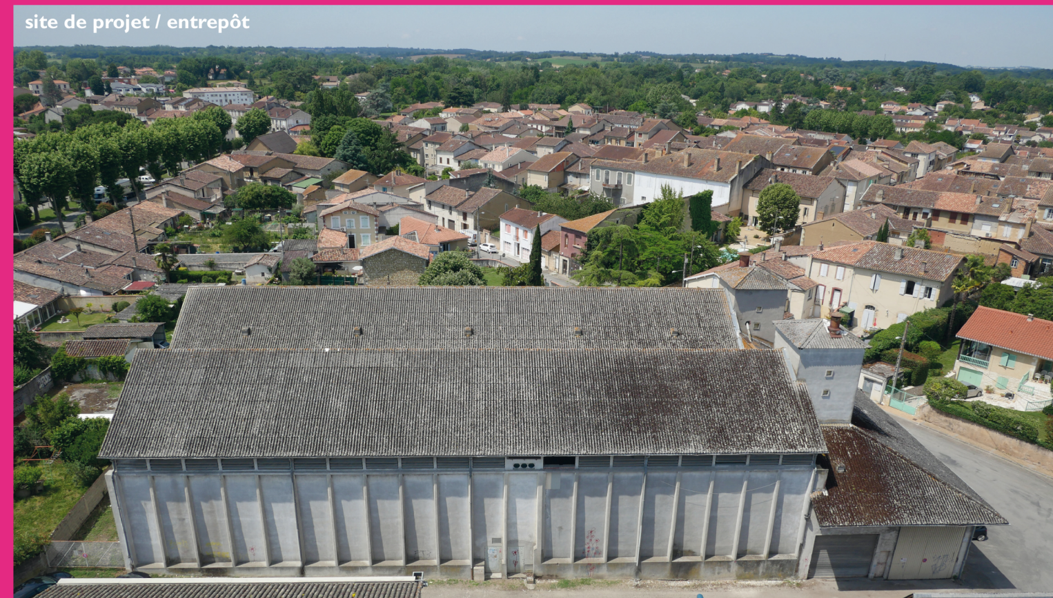
site de projet / entrepôt