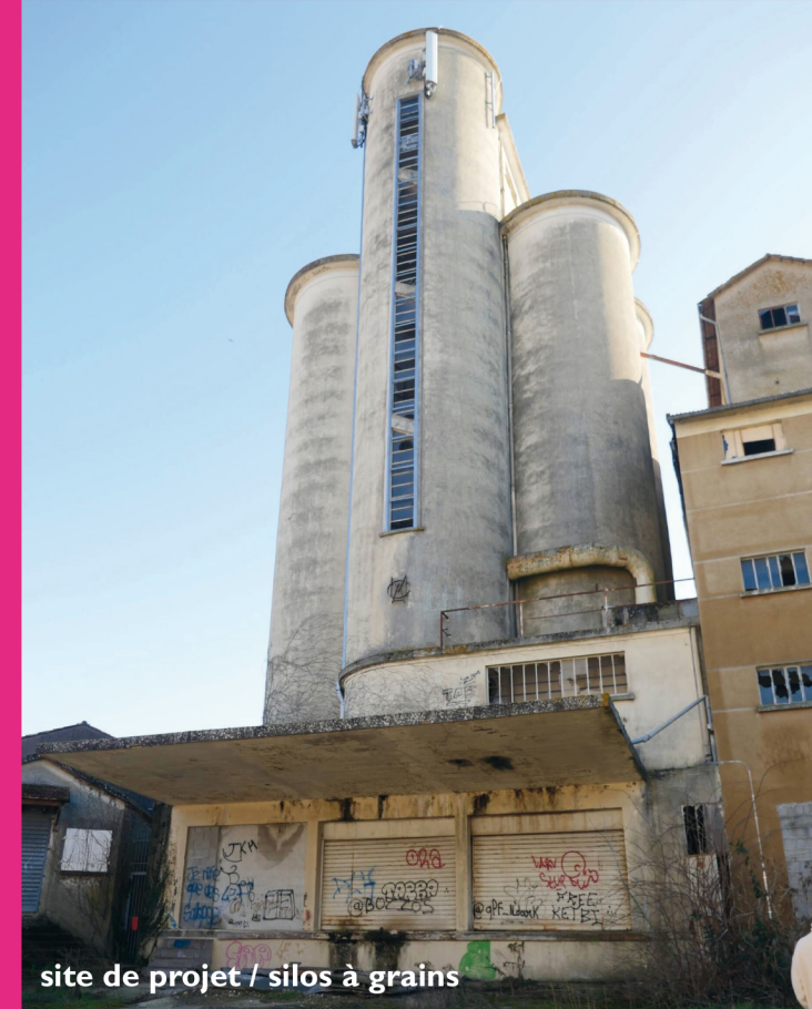
site de projet / silos à grains