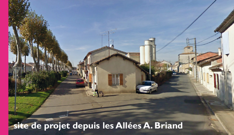
site de projet depuis les Allées A. Briand