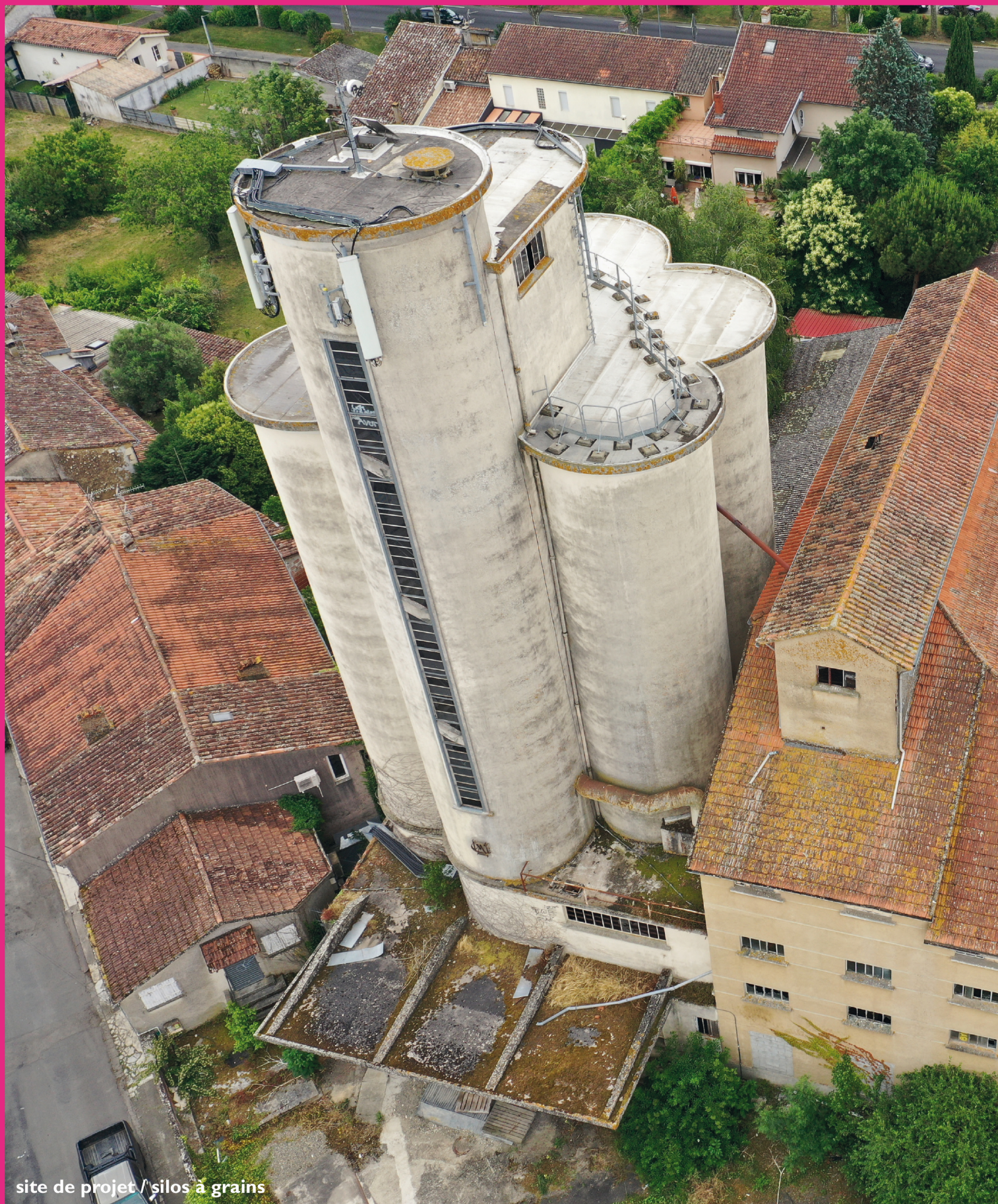
site de projet / silos à grains

Suites données au concours : études de faisabilité et missions de maîtrise d'oeuvre architecturales et urbaines