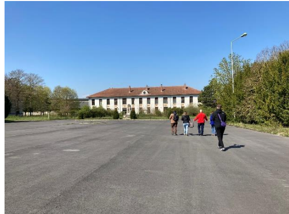
The HDR mess and the place of arm