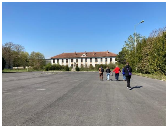
Le mess HDR et la place d'arme