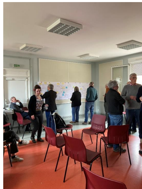
L'atelier de co design autour de la ville vivante et du programme Eco School.

La ville de Courcy et la SCIC Microville 112 ont été heureuses de cette journée de visite où ils ont pu réaffirmer les enjeux et objectifs qui leur tiennent à cœur. Ils remercient les futurs potentiels candidats et tous les autres intervenants pour leur présence et échanges et sont très enthousiastes de continuer cette belle aventure.