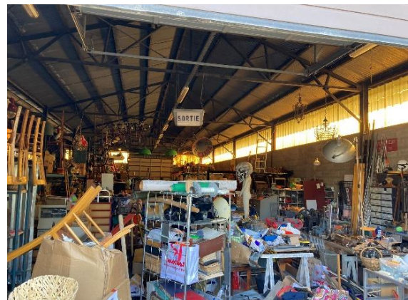
The gymnasium and the first tenants of the sheds (the place is used here for the storage and transformation of objects)