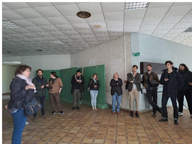
Le mess des sous-officiers

L'armée a entretenu le site pendant 10 ans, ce qui a permis au bâti d'être maintenue en bon état.