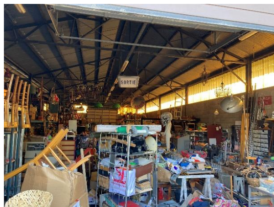
Le gymnase et les premiers locataires des hangars (le lieu est ici utilisé pour le stockage et la transformation d'objets)