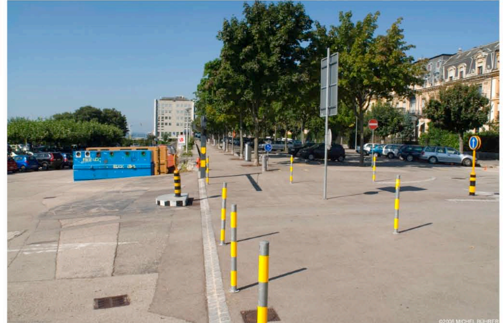
Limite du site de projet et quartiers d'habitations