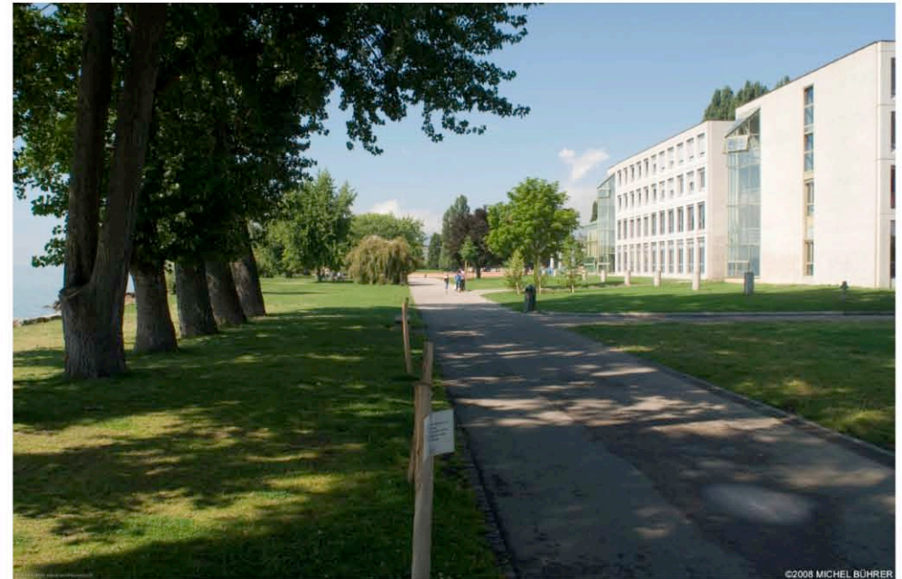
Promenade longeant le site de projet avec le Lac à gauche