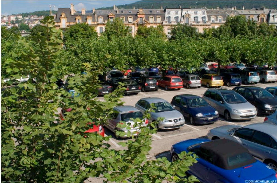
Parking dans le site de projet, zone à requalifier