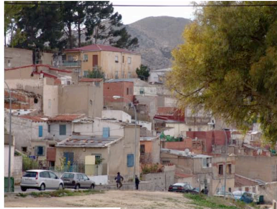
Barrio de Tafalera, área de proyecto. 3.