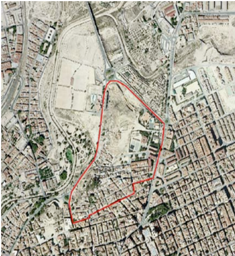
Foto aérea del contexto territorial