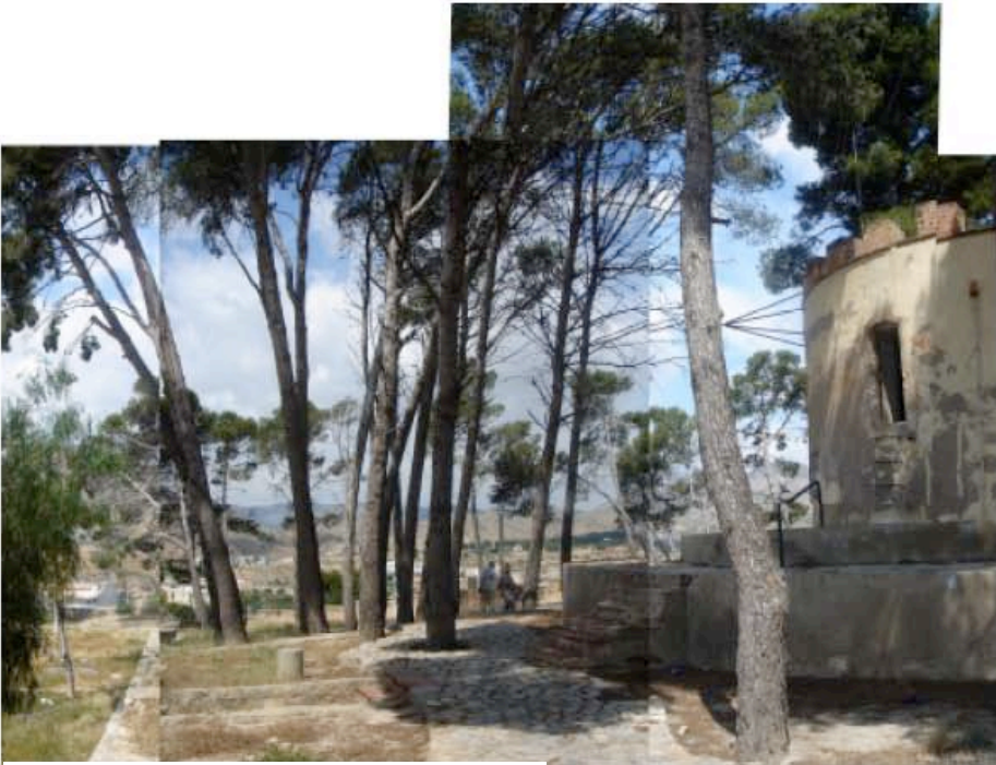
Alto de San Miguel, antiguo depósito de agua.