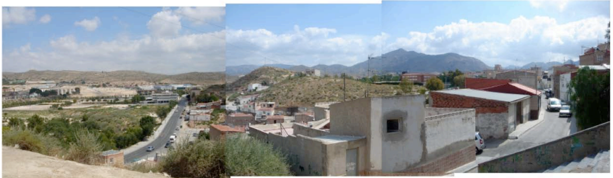
Vista de Tafalera desde el Alto de San Miguel