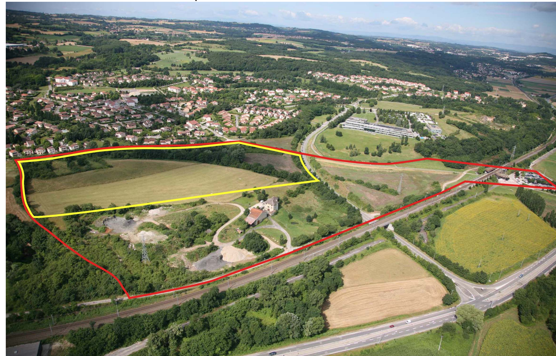
Photo aérienne du Site d'étude et du site de projet