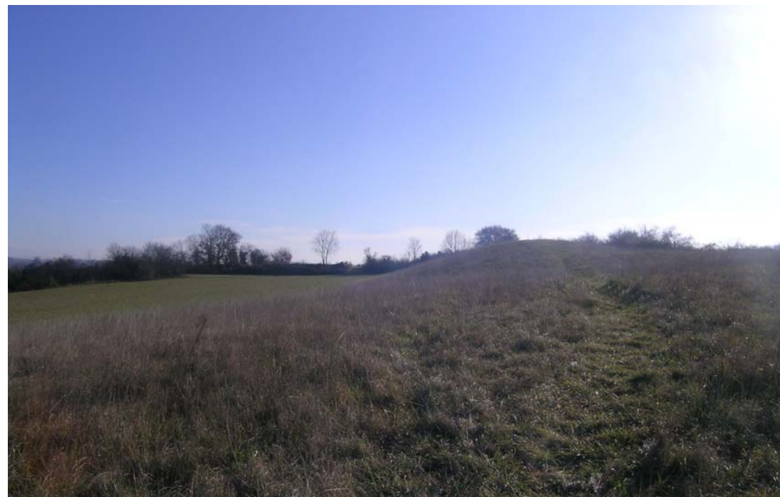
Vues du site d'étude