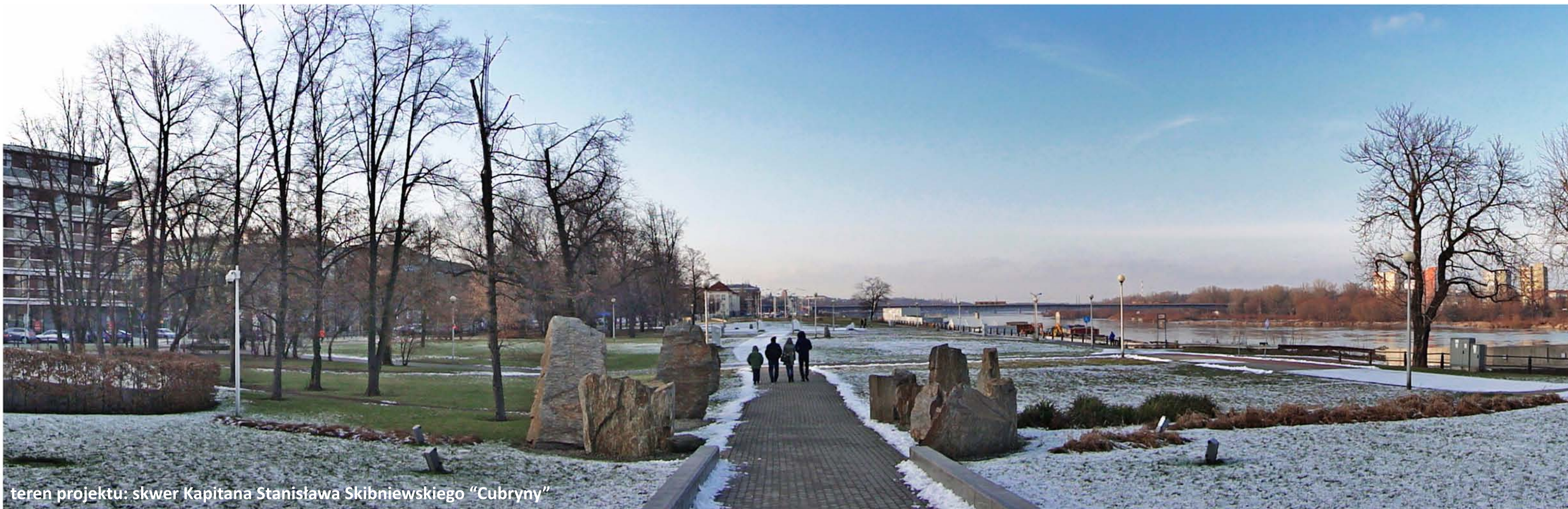
teren projektu: skwer Kapitana Stanisława Skibniewskiego "Cubryny"