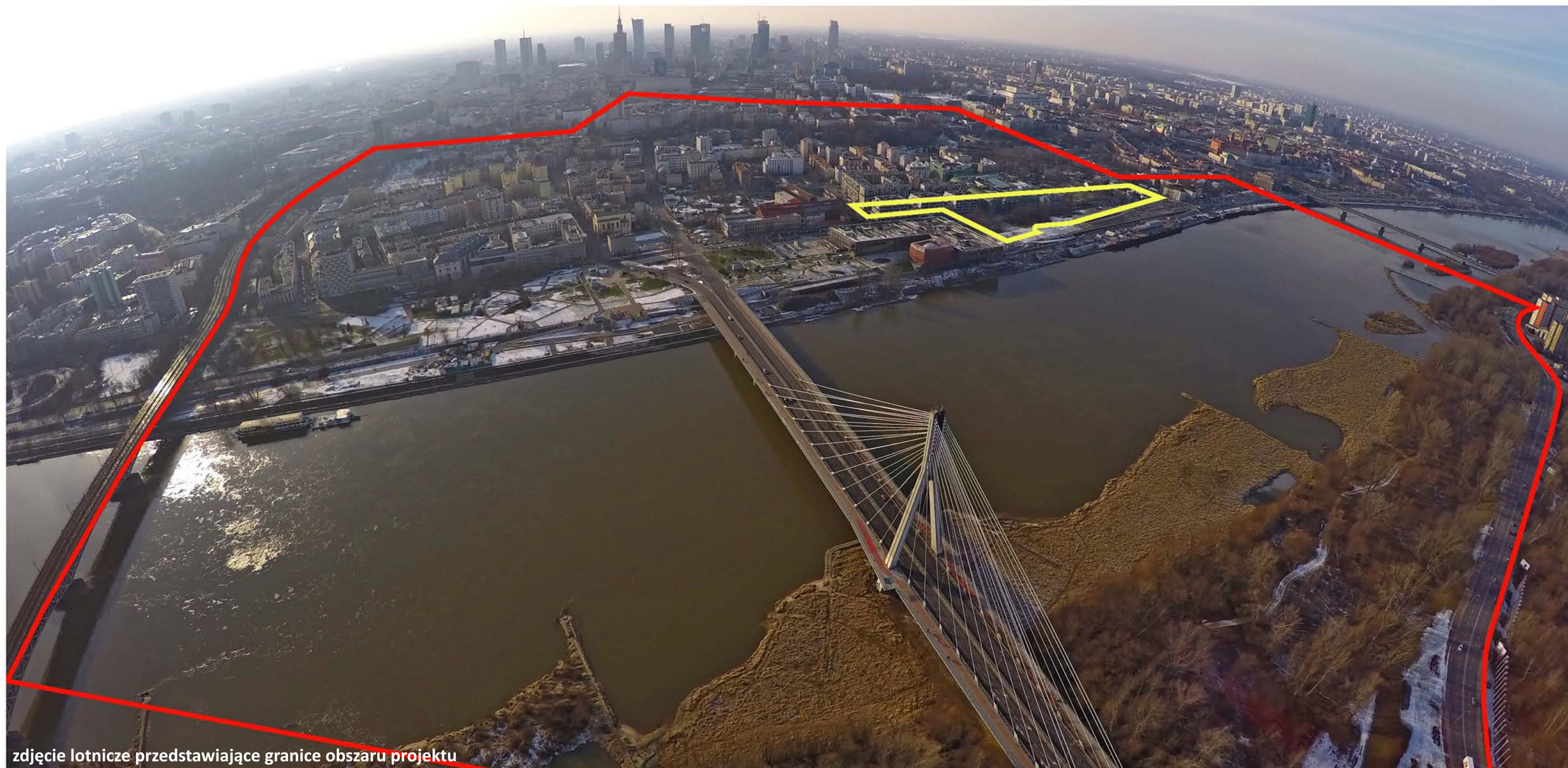
zdjęcie lotnicze przedstawiające granice obszaru projektu

RODZAJ PROJEKTU: architektoniczny/krajobrazowy