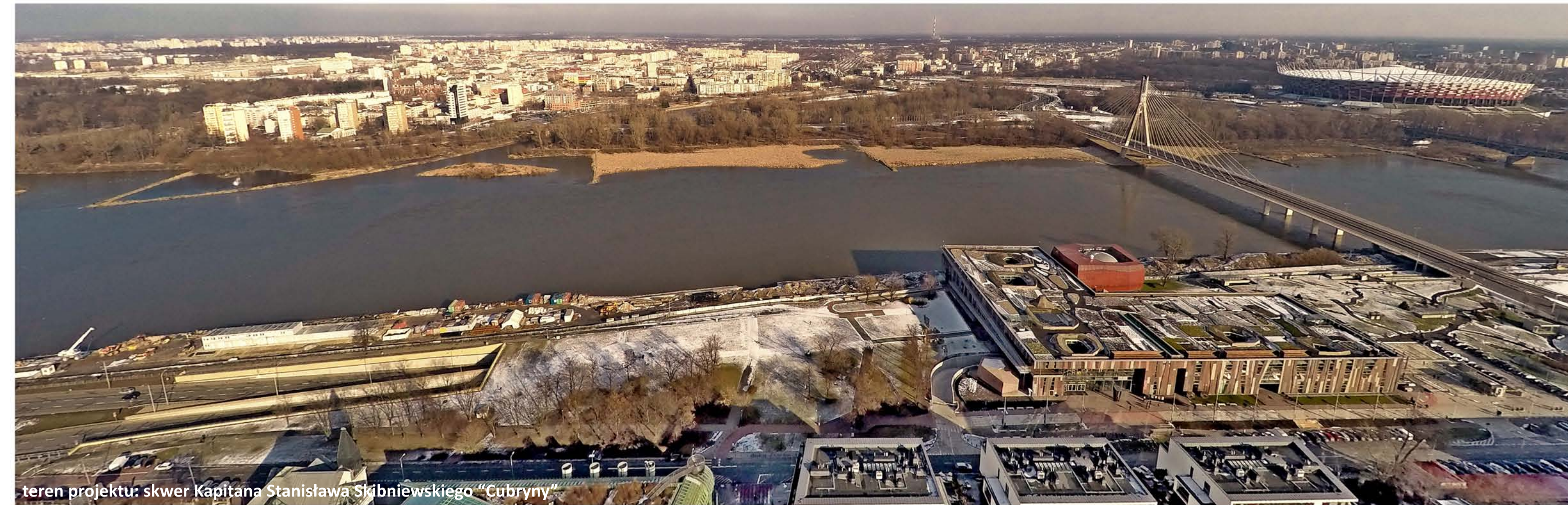
teren projektu: skwer Kapitana Stanisława Skibniewskiego "Cubryny"