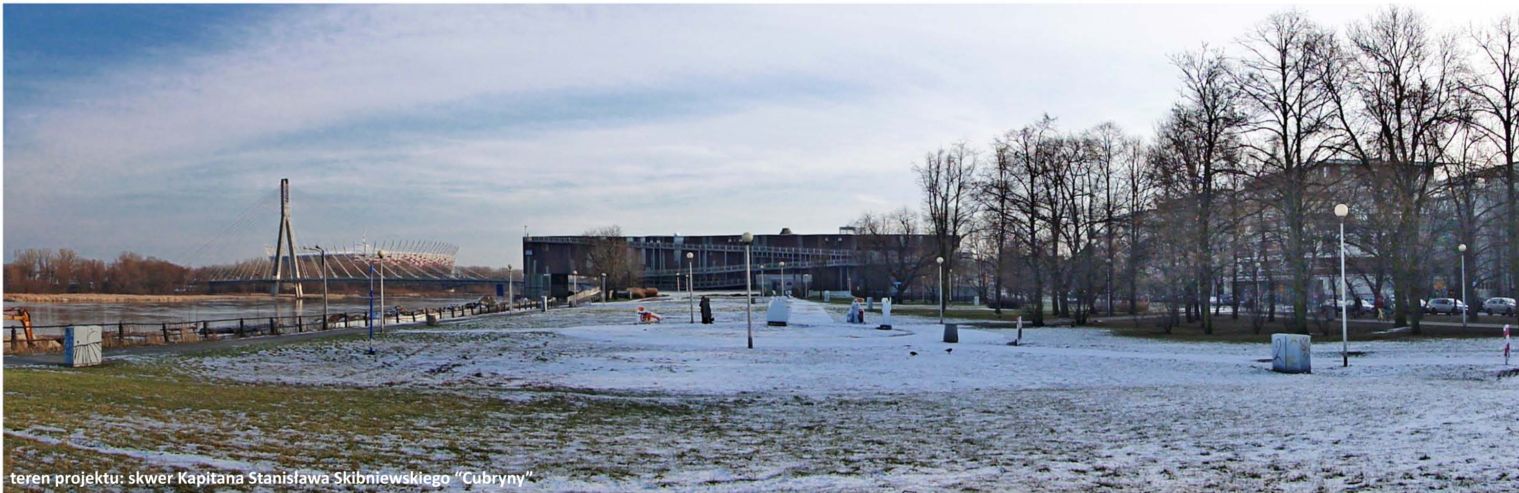
teren projektu: skwer Kapitana Stanisława Skibniewskiego "Cubryny"