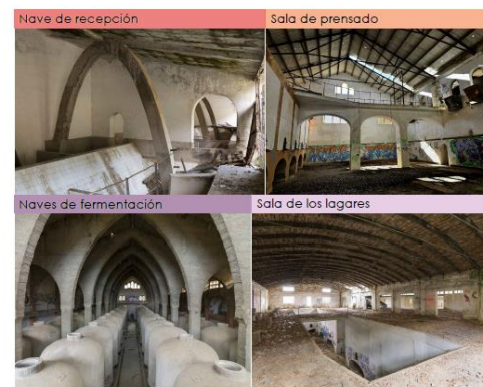
Imagen de plano adjunto en documento Directrices de intervención patrimonial en Es Sindicat (disponible en los Documentos específicos)

A grandes rasgos, en el mencionado documento se diferenciarán dos estrategias de actuación. Por una parte, la correspondiente a los espacios y salas consideradas centrales (núcleo de recepción, sala de prensados, naves de fermentación, sala de los lagares); y, por otra parte, la relativa al resto de espacios.